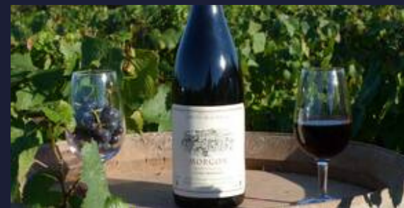
Les célèbres crus mâconnais